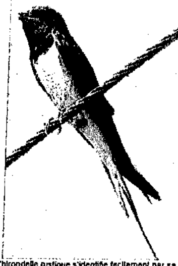
L'hirondelle rustique s'identifie facilement par sa queue fourchue.

Parmi les oiseaux côtoyant l'Homme, les hirondelles ont une place à part. Considérées comme annonciatrices du printemps et porteuses de chance, elles sont présentes dans les contes et les croyances populaires. Elles sont également des auxiliaires particulièrement intéressants dans la lutte contre la prolifération d'insectes volants comme les moustiques.